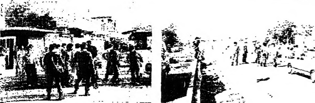
اعضاء اللجنة الامنية خلال مراقبتهم عملية ازالة المتاريس